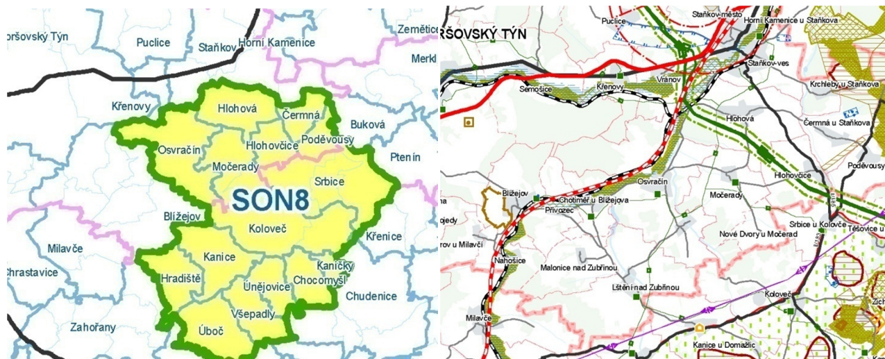
Výřez z výkresu Uspořádání území kraje ze ZÚR PK (vlevo)